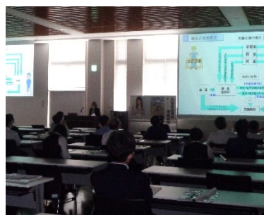
職長能力向上教育講習映像