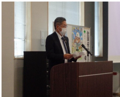
柳橋水戸地区労働災害防止部会長