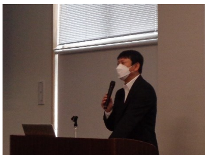
深津安全衛生課長